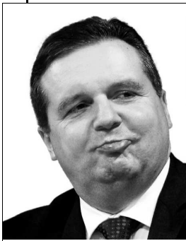
Mappus muss weg

Die Landesregierung mit ihrer neoliberalen, erzkonservativen CDU/FDP Politik unter Führung von Ministerpräsident Mappus hat abgewirtschaftet.