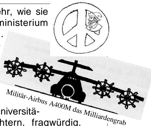
Militär-Airbus A400M das Milliardengrab

Soldat zu verpflichten. Daher kommen Jugendoffiziere und Wehrdienstberater