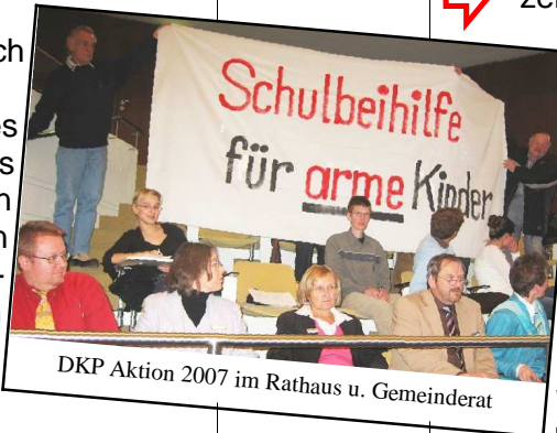
DKP Aktion 2007 im Rathaus u. Gemeinderat